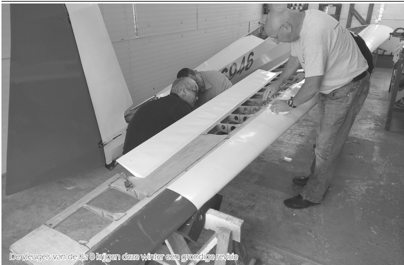
De vleugels van de Ka 8 krijgen deze winter een grondige revisie