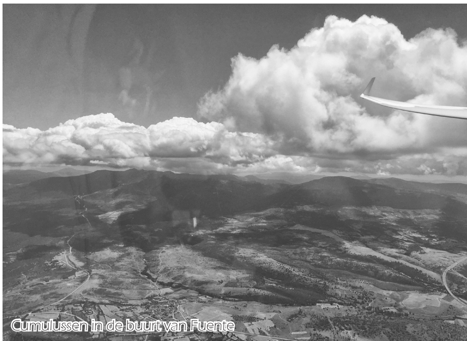
Cumulussen in de buurt van Fuente