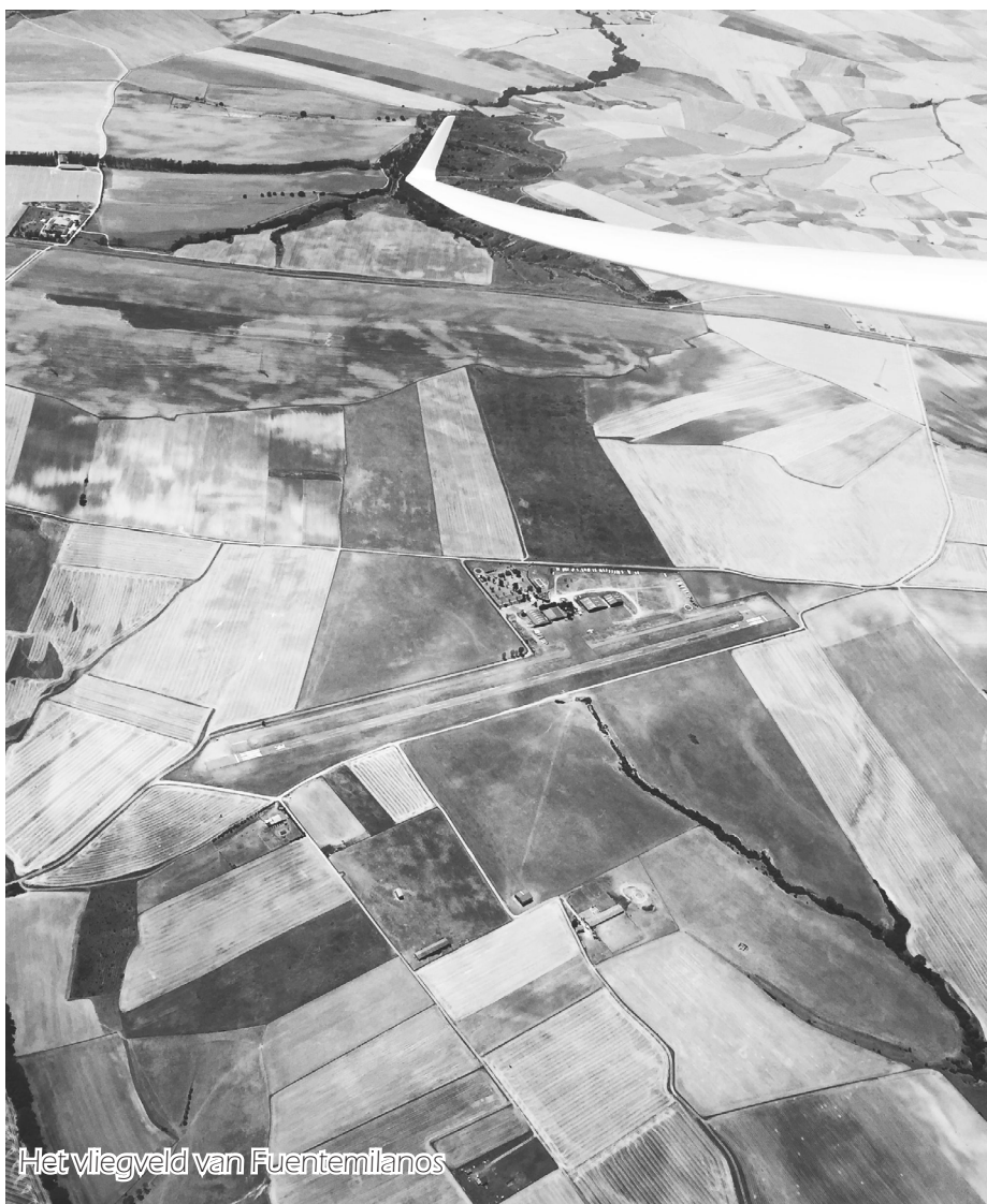
Het vliegveld van Fuentemilanos

Fuentemilanos busy glider line: https://www.youtube.com/watch?v=EiCdKHCWgmw