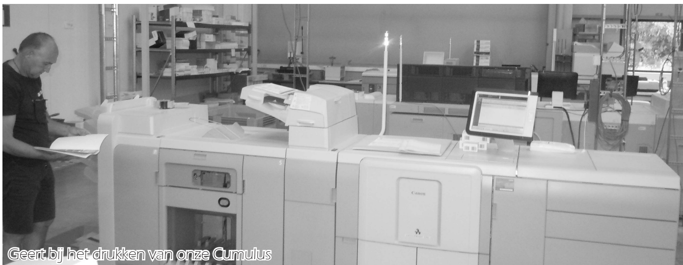
Geert bij het drukken van onze Cumulus