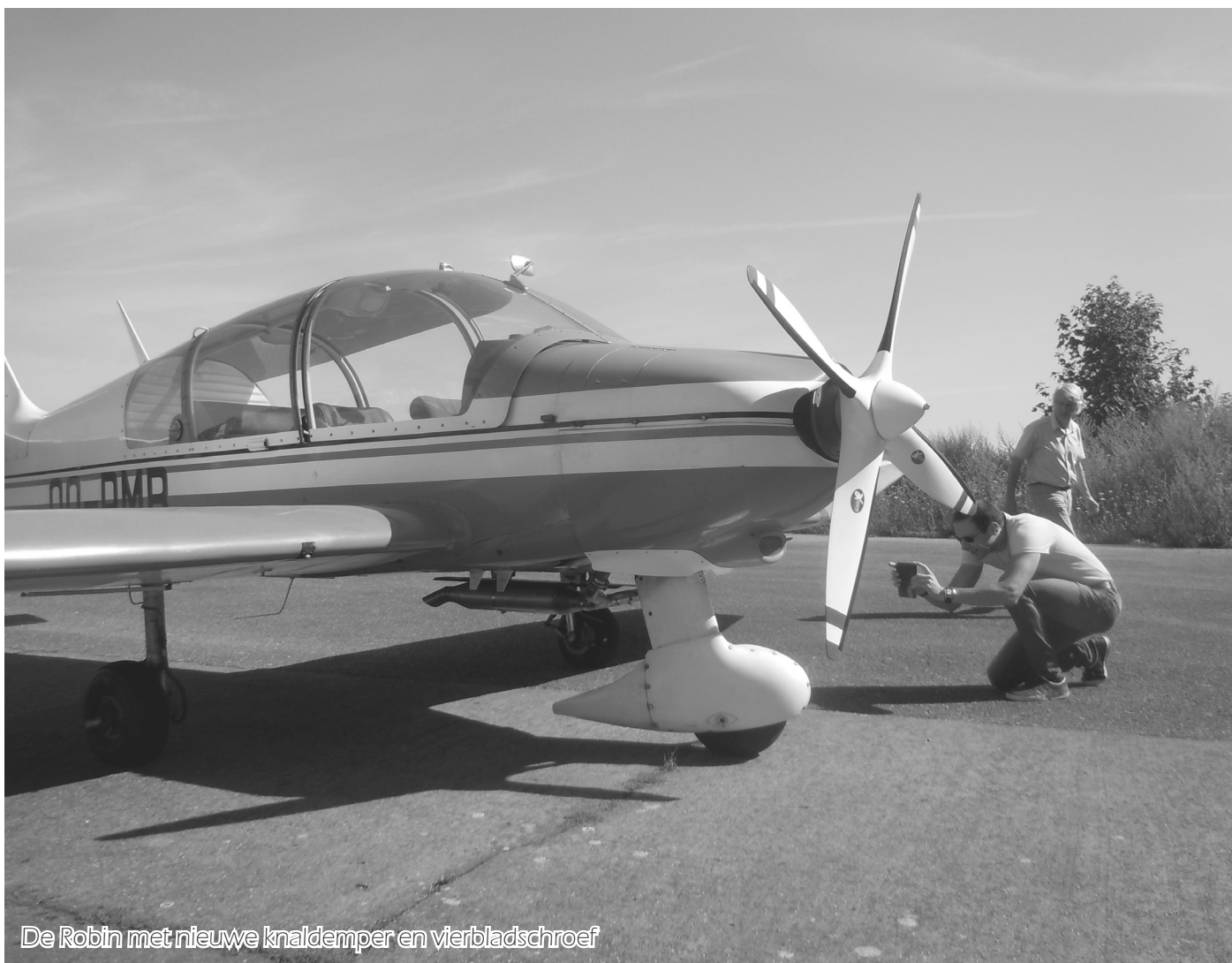
De Robin met nieuwe knaldemper en vierbladschroef