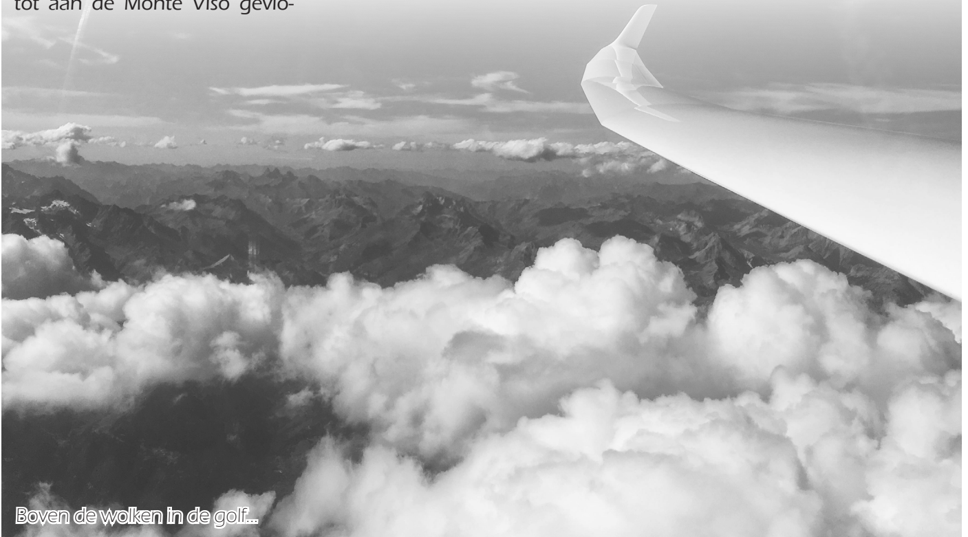
Boven de wolken in de golf...